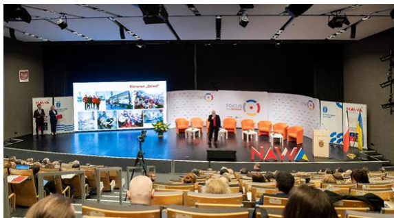
Focus on Ukraine