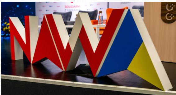
Solidarni z Ukrainą studenci, naukowcy, instytucje